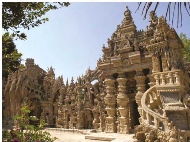
Maison idéale du facteur Cheval

Nous aurions pu aussi nommer ce parcours : la Table, l'Eau & le Vin !