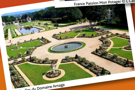
Les jardins du Domaine Arnaga