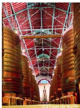
La cave de Byrrh