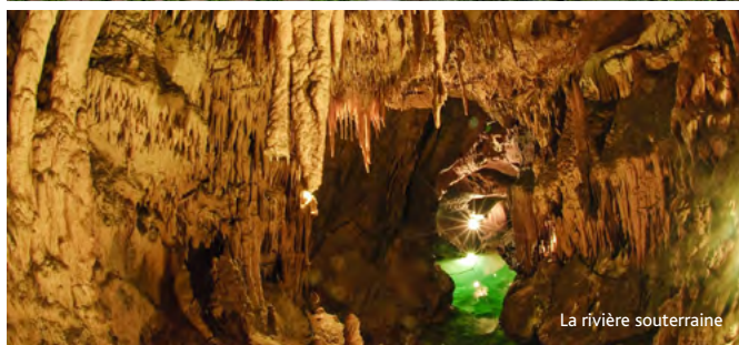
La rivière souterraine