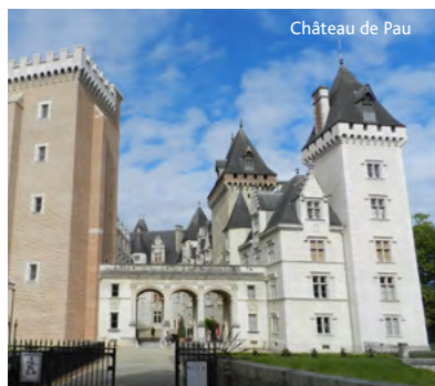
Château de Pau