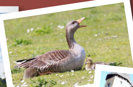
Les oies du Périgord Noir