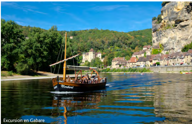
Excursion en Gabare