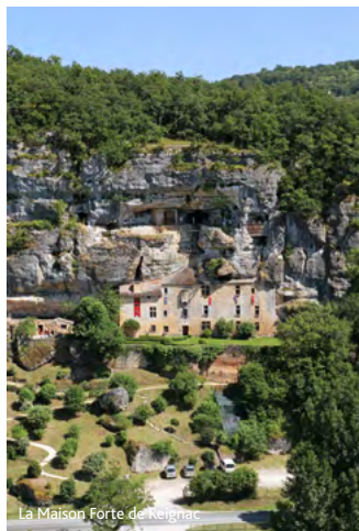
La Maison Forte de Reignac