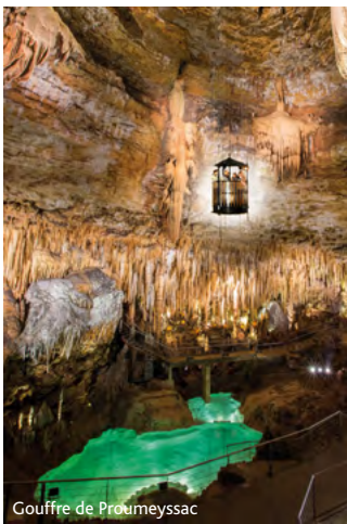
Gouffre de Proumeyssac