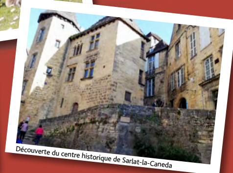
Découverte du centre historique de Sarlat-la-Caneda