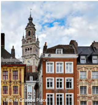
Lille, la Grande Place