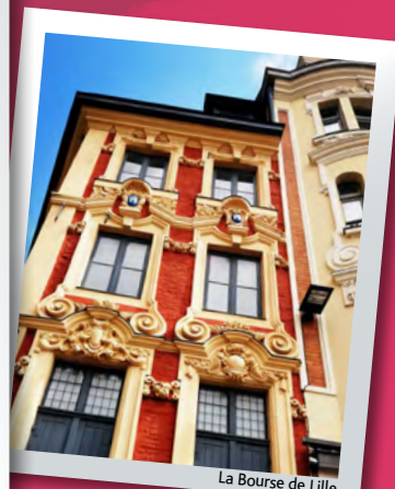
La Bourse de Lille