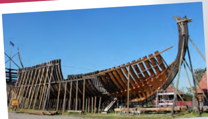
Le vaisseau Jean Bart

Escapade «Culture & Terroir» Du 26 mai au 09 juin 2023