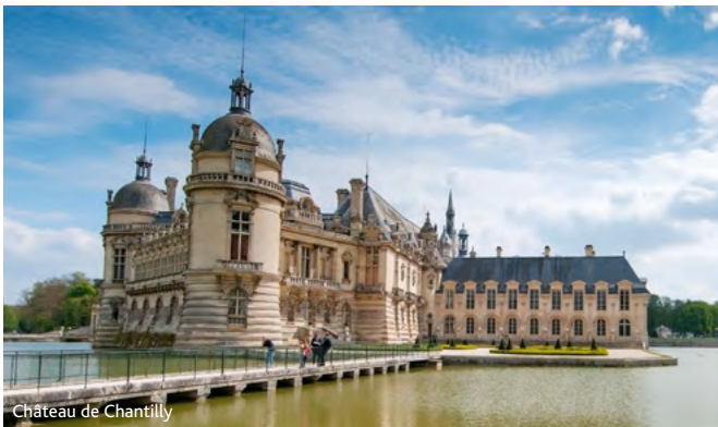
Château de Chantilly