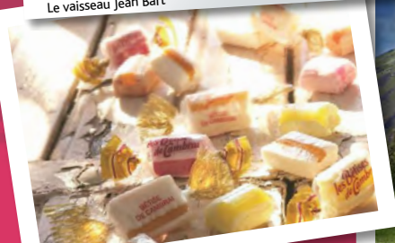
Les bêtises de Cambrai