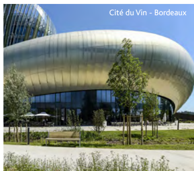
Cité du Vin - Bordeaux