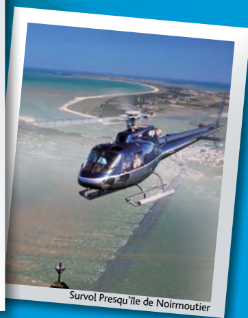
Survol Presqu'île de Noirmoutier

Que se cache-t-il derrière la dénomination « Arc Atlantique » ? Nous avons choisi de découvrir une partie de la façade Atlantique, du Golfe du Morbihan en Bretagne au bassin d'Arcachon en Aquitaine.