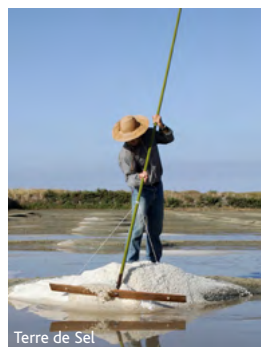
Terre de Sel