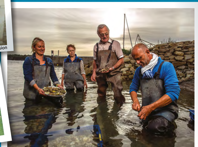
Bassin Marennes Oléron