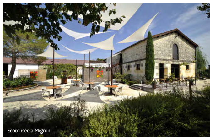
Ecomusée à Migron